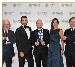
Milano Contract District Eccellenza dell'Anno Real Estate Servizi per il Mercato Residenziale