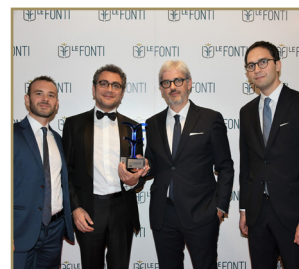
Studio Legale Miceli Vento Team Legale dell'Anno Boutique di Eccellenza Diritto Amministrativo Consulenza