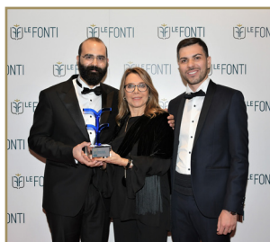
Napoletano Ficco Turchetto Studio Legale Team Legale dell'Anno Boutique di Eccellenza Diritto Penale Ambientale