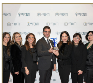
Studio Legale Sgromo Studio Legale Dell'Anno Responsabilità Medica