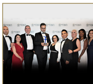
Finlibera Eccellenza dell'Anno Marketing & Comunicazione Soluzioni Immobiliari