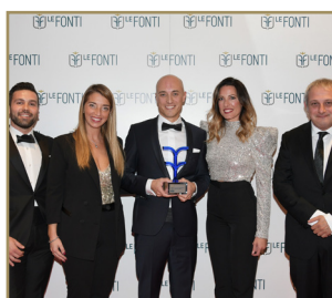
Gargano Studio Legale & Consulenza Studio dell'Anno Emergente Diritto del Turismo