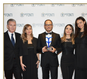
Studio Legale Scipioni Boutique di Eccellenza dell'Anno Diritto Sanitario Responsabilità Medica