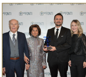
Terranova Eccellenza dell'Anno Ricerca & Sviluppo Strumentazione di Processo