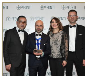
Steel Tech Eccellenza dell'Anno Innovazione & Leadership Lavorazione Acciaio