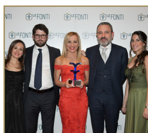
R&G Rossi Giua Marassi & Associati Boutique di Eccellenza dell'Anno Diritto Amministrativo Contrattualistica