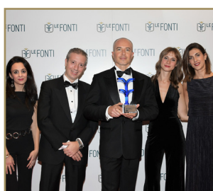
Prisco e Partners Boutique di Eccellenza dell'Anno Consulenza Diritto del Lavoro