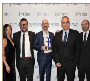
Technicae Progressum Eccellenza dell'Anno Innovazione & Sostenibilità Isolamento Termico