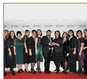
Gruppo Danone HR Team dell'Anno Settore Alimentare