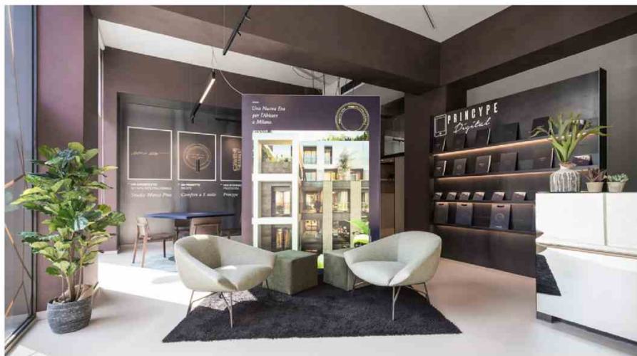
Entrance of the Pringype InfoPoint