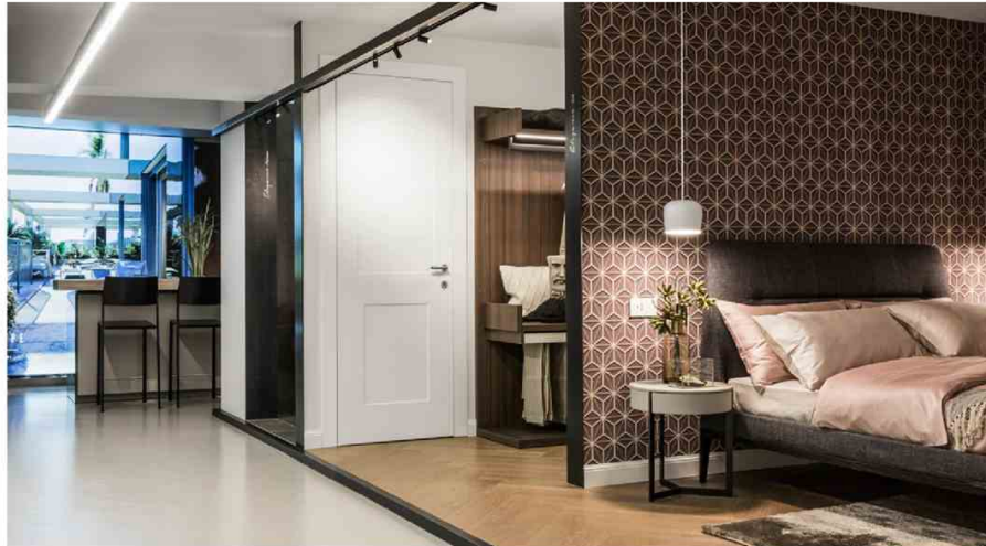
Representation of interior contextual boxes and fit - out specifications