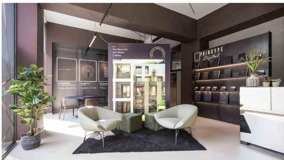
Entrance of the Princype InfoPoint