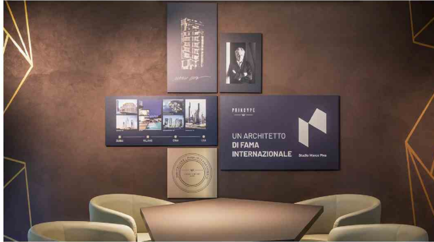
Internal infographic dedicated to the architect Marco Piva