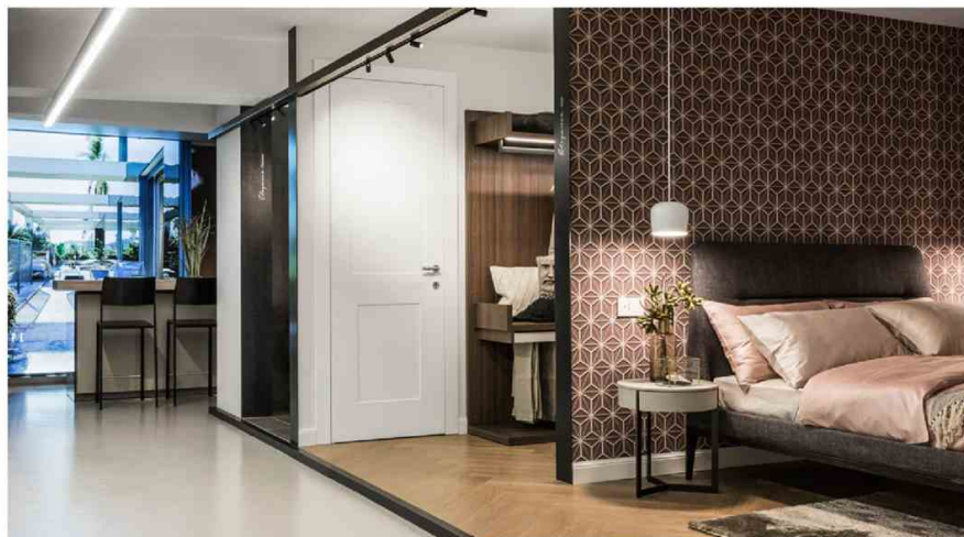
Representation of interior contextual boxes and fit - out specifications