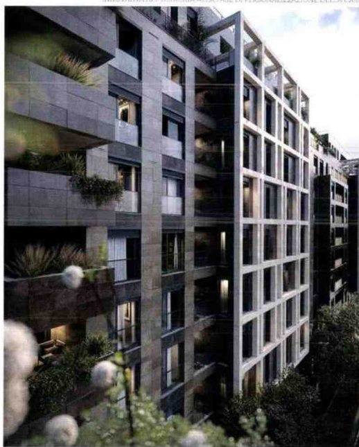
SOTTO, PRINCIPALE, IL NUOVO PROGETTO IMMOBILIARE MILANESE A CURA DELLO STUDIO MARCO PIVA, PER CUI MILANO CONTRACT DISTRICT È PARTNER DEI PRODOTTI E SERVIZI LEGATI ALL'HOMEDESIGN. MCD HA INOLTRE REALIZZATO IL CONCETTO DELL'ESCLUSIVO STUDIO PENSATO PER POTER VIVERE IN ANTICIPAZIONE L'ESPERIENZA DELLA FUTURA CASA. DI MASSO, UNA SCORRIATA DI HOME A INNOVATIVA APP DEDICATA ALLA FASE DI PERSONALIZZAZIONE DELLA CASA.

consacrata al home cinema può trasformarsi in bed room. Grazie a More+Space e alla sua idea di arredi dinamici, appartamenti di qualsiasi superficie sono ripensati come un insieme di funzioni, fatti di pareti mobili e soluzioni arredative modificabili per ampliare, moltiplicare, comporre e, se necessario, celare gli ambienti, ricavando il massimo del comfort da ogni spazio a disposizione. "More+Space è nato dall'idea di sviluppare layout innovativi e flessibili con cui si possano attribuire a un'unica stanza differenti destinazioni d'uso nel corso della giornata", spiega Pascucci. "Il lancio di quell'idea, col sereno di poi, ha rappresentato l'anticipazione di un bisogno che oggi, con il massiccio ricorso allo smart working, è esploso come un'esigenza imprescindibile. Già