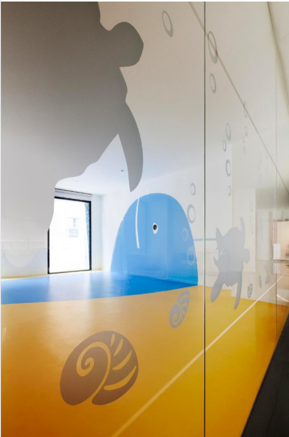
Fig.19 Studio di Architettura e Urbanistica Carbonell e Roberto Imperato, Pomaseiuno, Milano, 2017