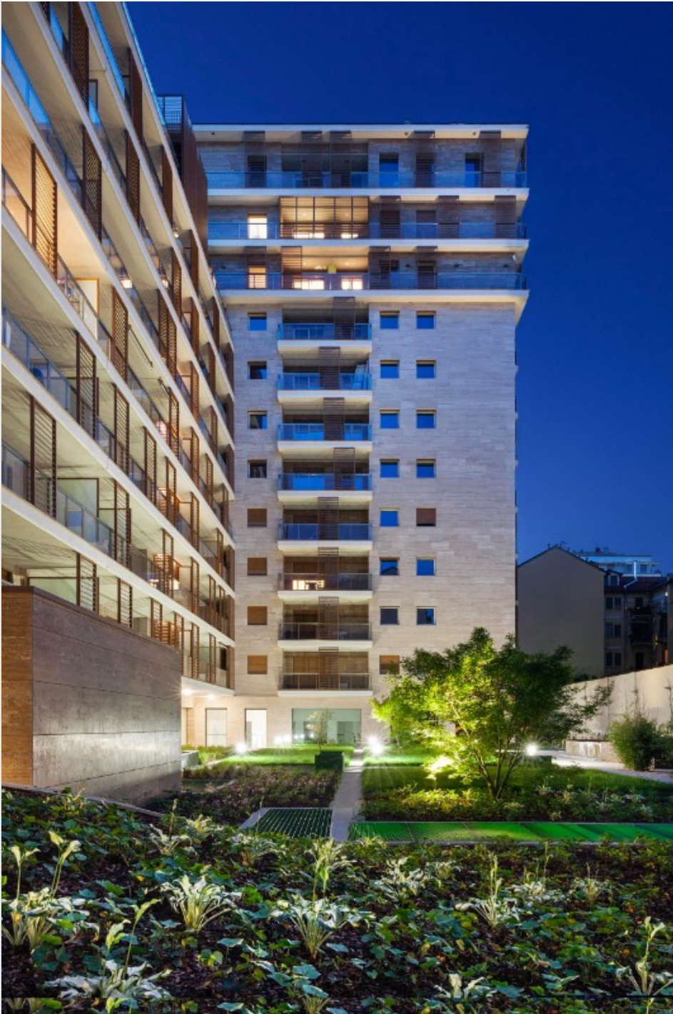
Fig.17 Studio di Architettura e Urbanistica Carbonell e Roberto Imperato, Pomaseiuno, Milano, 2017