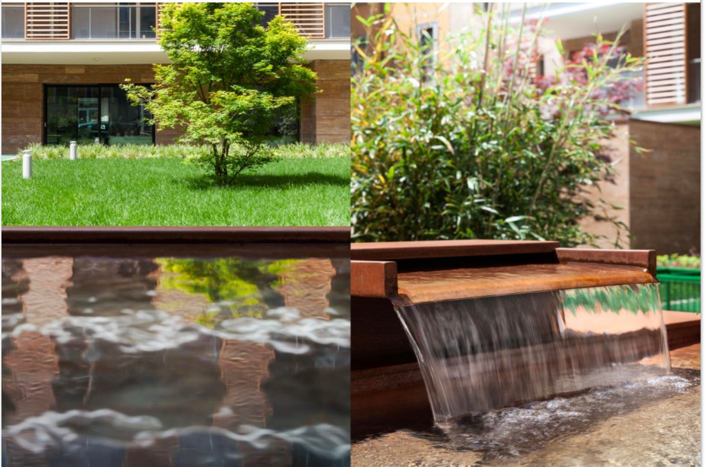
Fig.18 Studio di Architettura e Urbanistica Carbonell e Roberto Imperato, Pomaseiuno, Milano, 2017