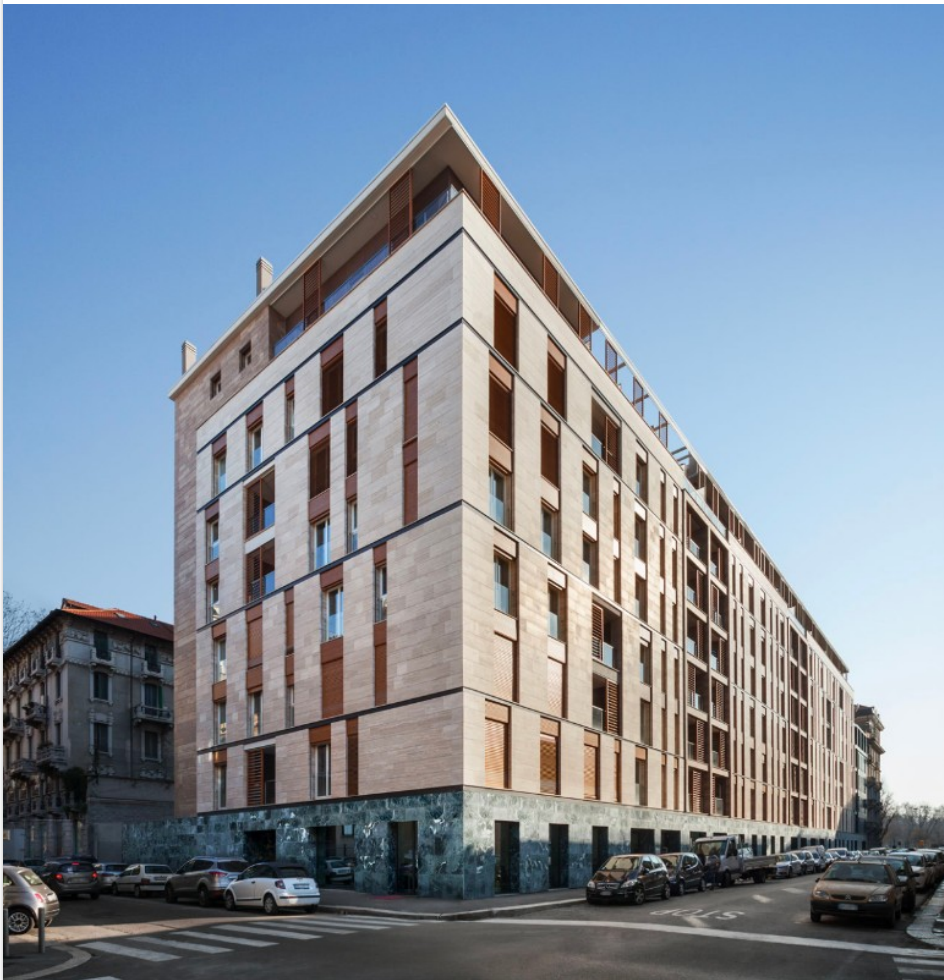
Fig.15 Studio di Architettura e Urbanistica Carbonell e Roberto Imperato, Pomaseiuno, Milano, 2017

Il contesto in cui si cala il progetto impone un'attenta riflessione sul ruolo dell'intero edificio, sul legame che questo instaura con le costruzioni contigue preesistenti, sulle dinamiche ed i movimenti già in atto, sulla natura generale dell'area. Topograficamente, la parte di città interessata è un insieme di isolati ben delineati, che dà vita ad un reticolo preciso e gerarchizzato di strade parallele e perpendicolari. La regola perseguita per la definizione dello sviluppo planimetrico del progetto è la ricomposizione dell'isolato, attraverso un volume chiaro principale che, allineandosi agli edifici adiacenti, crea una netta divisione fra esterno ed interno, fra strada e corte, fra pubblico e privato, collettivo ed individuale.