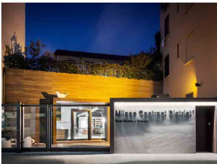
Milano Contract District

Sono ormai 4 anni che Milano Contract District ha avviato la propria attività a Milano , fin da subito si ebbe l'impressione di essere approdati – come direbbe Bennato – sull'” Isola che non c'è ”: una formula innovativa, una rete di partner scelti e consapevoli, un modello di business che non si era mai visto, rigoroso e trasparente e che puntava sul mix tra prodotto e servizio. E i risultati non tardarono ad arrivare. Nel 2016 MCD rimescola le carte al tavolo del real estate milanese (e non solo) e crea quella catena virtuosa che tutti i developer e gli operatori immobiliari del mondo vorrebbero avere.